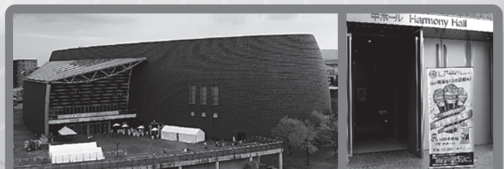
なら100年会館 (ならひやくねんかいかん)

奈良市市制施行100周年の一環として、1999年2月1日に開館。設計者は建築家の磯崎新。奈良県民に広く親しまれている。会場となった中ホールは434席。クラシックなどの演奏会に利用されている。