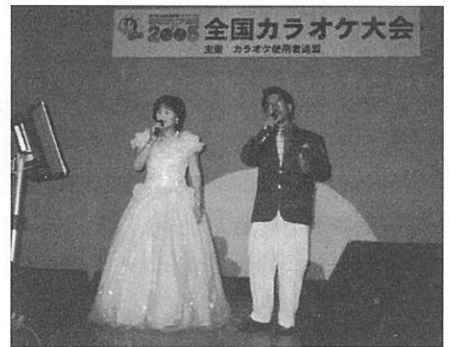
息の合った歌声を披露する男女ペア。