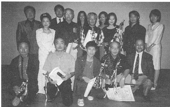
各賞受賞者と審査員