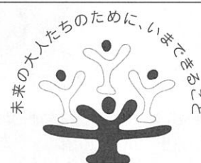
「子どもの居場所づくり」キャンペーン 文部科学省

といった内容で、「子どもたちが自分 達のマナーで運営する自由交流の場」 として活動しています。