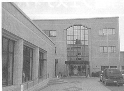
カラオケ大会会場 松山市・愛媛県女性総合センター・ 多目的ホール外観