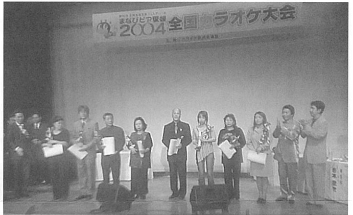
興奮冷めやらぬ表彰式

参加者からは、次年度以降も継続開催を望む声が多数あり、当連盟としても、こうしたカラオケ発表の場を今後積極的に設けて参りたく考えております。