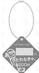
▲ボトルネック 50個 50×50mm