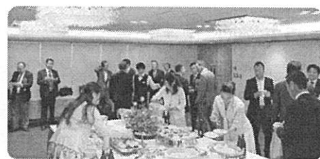
懇親会にて歓談の様子