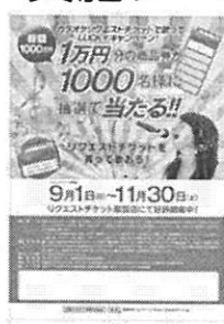
▲促進キャンペーンポスター1枚 B3